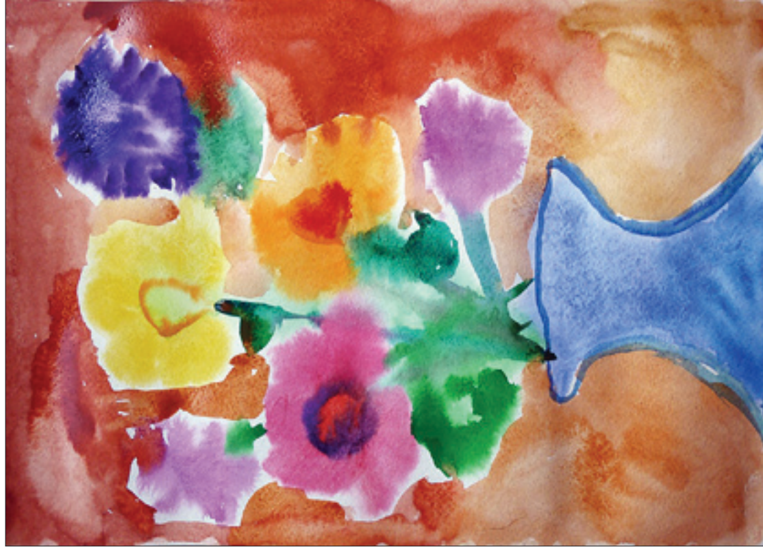
Ковалева Аглая. Ваза с цветами.